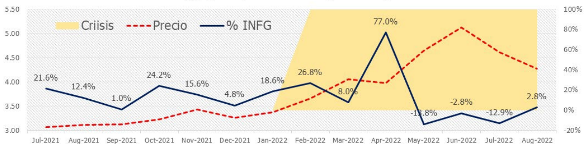
Tasa Interanual INFG vs Precio de la Gasolina ($/ galón, Julio 21 a Agosto 22)